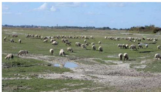
Prés salés en baie de Somme