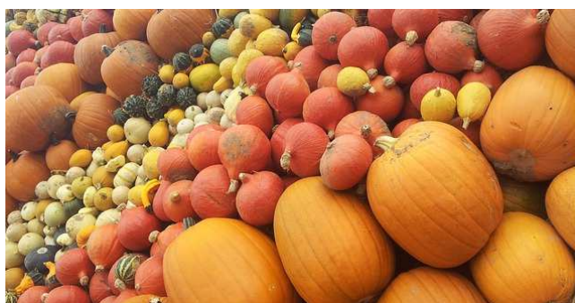
Courges...fruits de saison

Éditeur responsable : Alain HEBERT – Rue Chantraine, 14 – 4357 DONCEEL