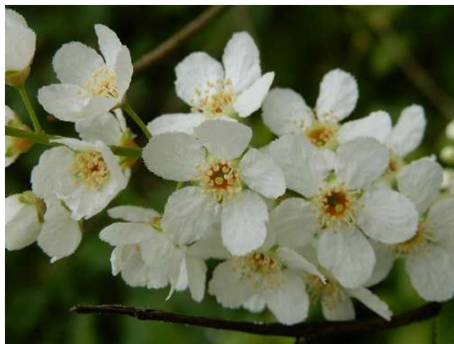
La nature en plein festival...